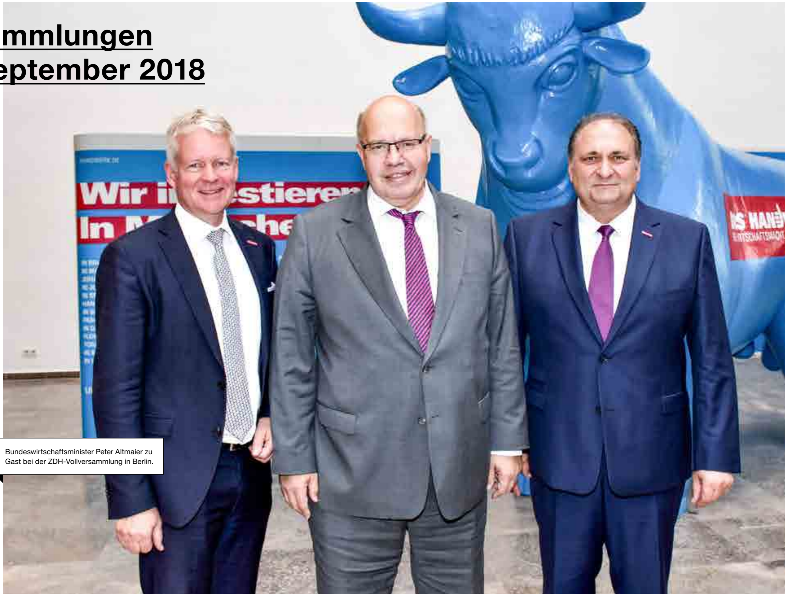
Bundeswirtschaftsminister Peter Altmaier zu Gast bei der ZDH-Vollversammlung in Berlin.