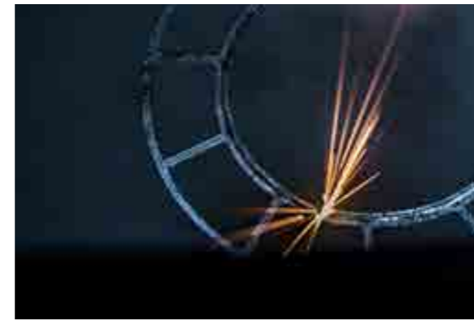
Der Prototypenhersteller Kegelmann Technik aus Rodgau-Jügesheim in Hessen entwickelt für seine Kunden Modelle, Prototypen, Werkzeuge und Endprodukte.

Er selbst ist mit seiner Entscheidung für das Handwerk bis heute glücklich. An seinem Job schätzt er vor allem die Abwechslung: „An einem Tag treffe ich einen Landmaschinenhersteller, am nächsten Tag einen Orthopädietechniker und am dritten Entwickler aus dem Automotive-Bereich. Vom Erfinder bis zum Großunternehmer ist alles dabei.“