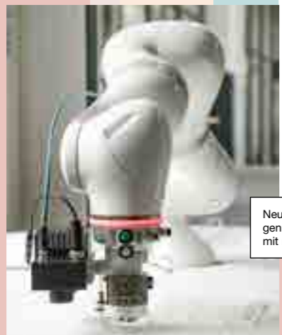
Neue Methoden und Lösungen im digitalen Modellbau mit moderner Robotik.

ve Tools, die zum selben Kreis gehören, wie zum Beispiel Augmented Reality, Maschinenlernen und -sensorik. In diesen Bereichen eröffnen sich gerade ganz neue Möglichkeiten – auch für das Handwerk. Denn ein kollaborativer Roboterarm („Cobot“) funktioniert ja schlussendlich wie ein vielseitiges Handwerkszeug oder eine Art „Dritte Hand“.