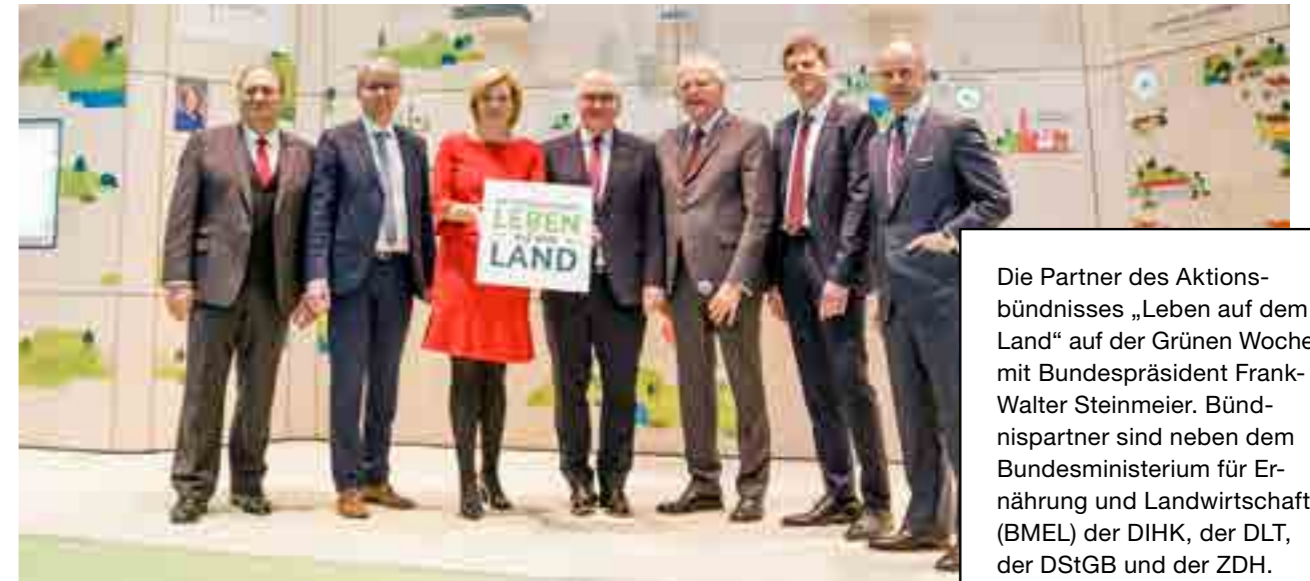
Die Partner des Aktionsbündnisses „Leben auf dem Land“ auf der Grünen Woche mit Bundespräsident Frank-Walter Steinmeier. Bündnispartner sind neben dem Bundesministerium für Ernährung und Landwirtschaft (BMEL) der DIHK, der DLT, der DStGB und der ZDH.