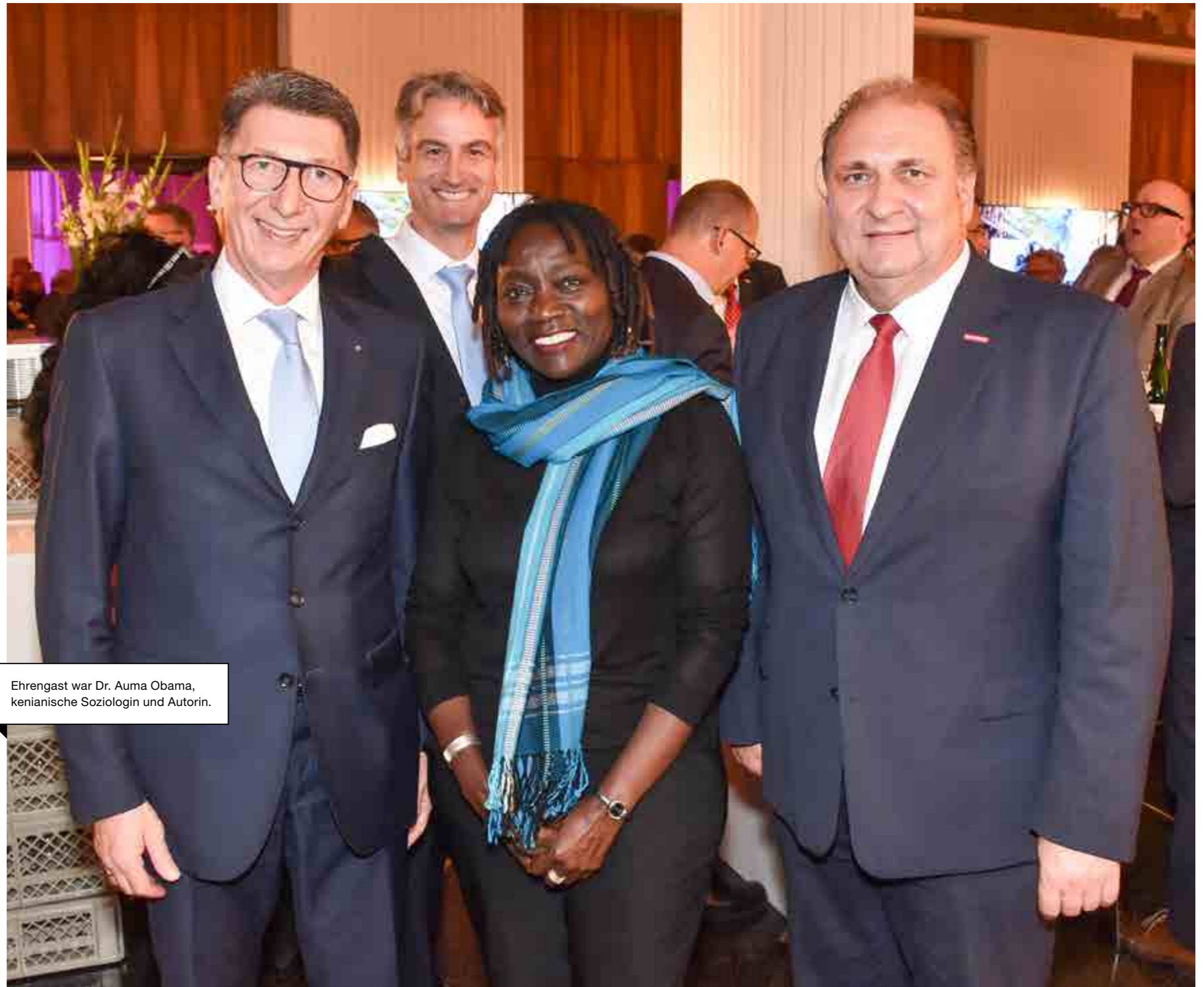
Ehrengast war Dr. Auma Obama, kenianische Soziologin und Autorin.