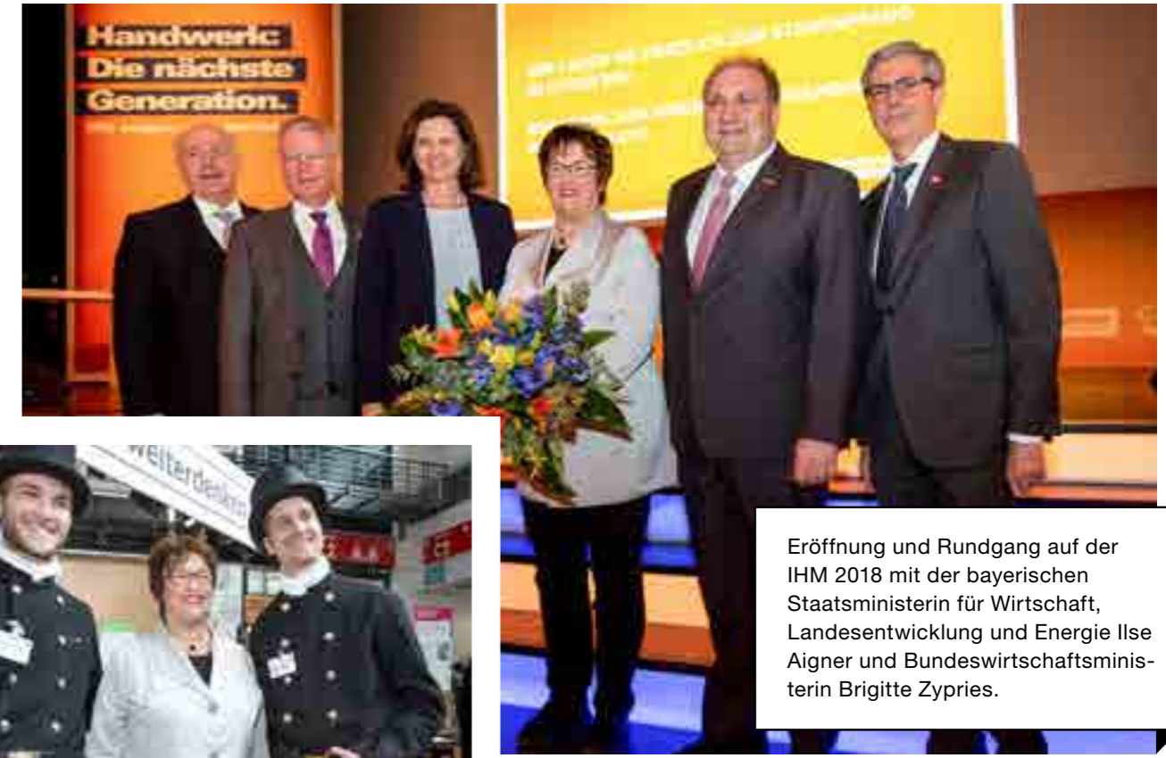
Eröffnung und Rundgang auf der IHM 2018 mit der bayerischen Staatsministerin für Wirtschaft, Landesentwicklung und Energie Ilse Aigner und Bundeswirtschaftsministerin Brigitte Zypries.