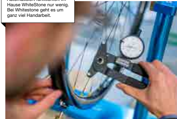
Automatisiert funktioniert im Hause WhiteStone nur wenig. Bei Whitestone geht es um ganz viel Handarbeit.

Ja, das Geld. Als junges Start-up steht man immer vor Finanzierungsproblemen. Ohne ausreichendes Kapital verschiebt sich nicht nur der