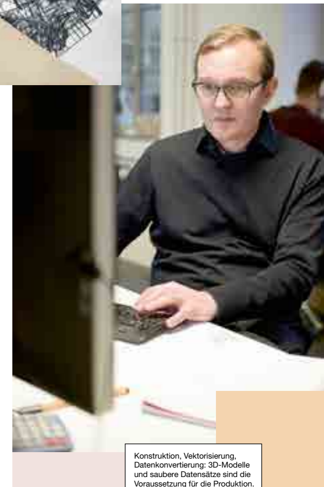
Konstruktion, Vektorisierung, Datenkonvertierung: 3D-Modelle und saubere Datensätze sind die Voraussetzung für die Produktion.

Wenn wir Besucher und Kunden durch unsere Räume führen und erklären, wie wir arbeiten, merken wir oft, wie veraltet das Berufsbild in der allgemeinen Wahrnehmung ist. Da muss man aufklärerisch tätig sein, um zu zeigen, dass die Welt nicht in 3D gedruckt wird, sondern dass es immer noch handwerkliche Prozesse sind, die sich aber sehr stark gewandelt haben. Mir liegt daran, für den technischen Modellbau eine Lanze zu brechen, um zu zeigen, was heute möglich ist – gerade im Vergleich zu Industrielösungen. Unser Handwerk sorgt für das Besondere, könnte man so sagen.