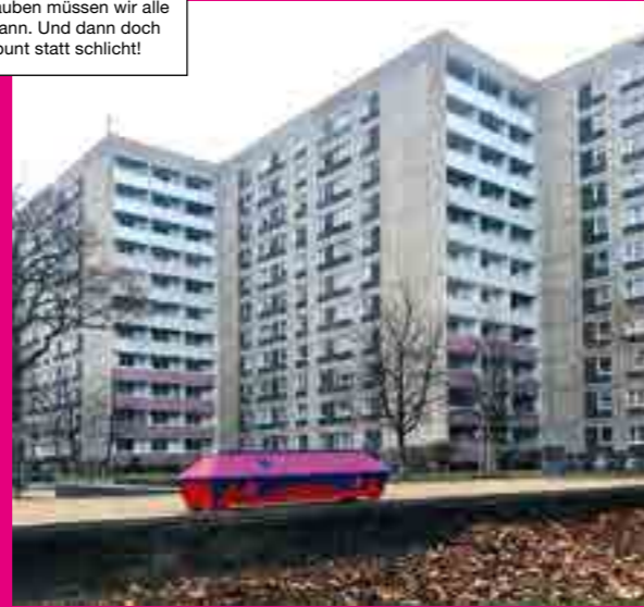
Dran glauben müssen wir alle irgendwann. Und dann doch besser bunt statt schlicht!

gekehrt er die Fragen – prominenten Gästen wie dem Schauspieler Clemens Schick oder den Sängerinnen Balbina und Judith Holofernes.