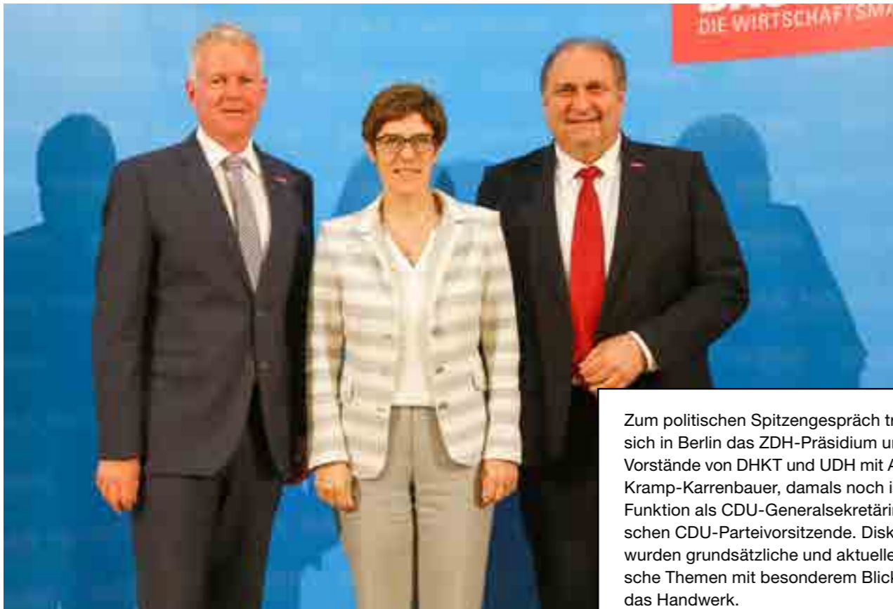
Zum politischen Spitzengespräch trafen sich in Berlin das ZDH-Präsidium und die Vorstände von DHKT und UDH mit Annegret Kramp-Karrenbauer, damals noch in ihrer Funktion als CDU-Generalsekretärin, inzwischen CDU-Parteivorsitzende. Diskutiert wurden grundsätzliche und aktuelle politische Themen mit besonderem Blick auf das Handwerk.