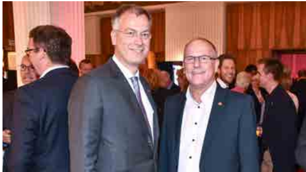
Politik trifft Handwerk – Abend der Begegnung im Haus des Deutschen Handwerks. Neben den vielen Vertreterinnen und Vertretern aus der Handwerksorganisation waren Politikerinnen und Politiker aus Bund und Ländern sowie Vertreterinnen und Vertreter aus Wirtschaft und Gesellschaft zu Gast.