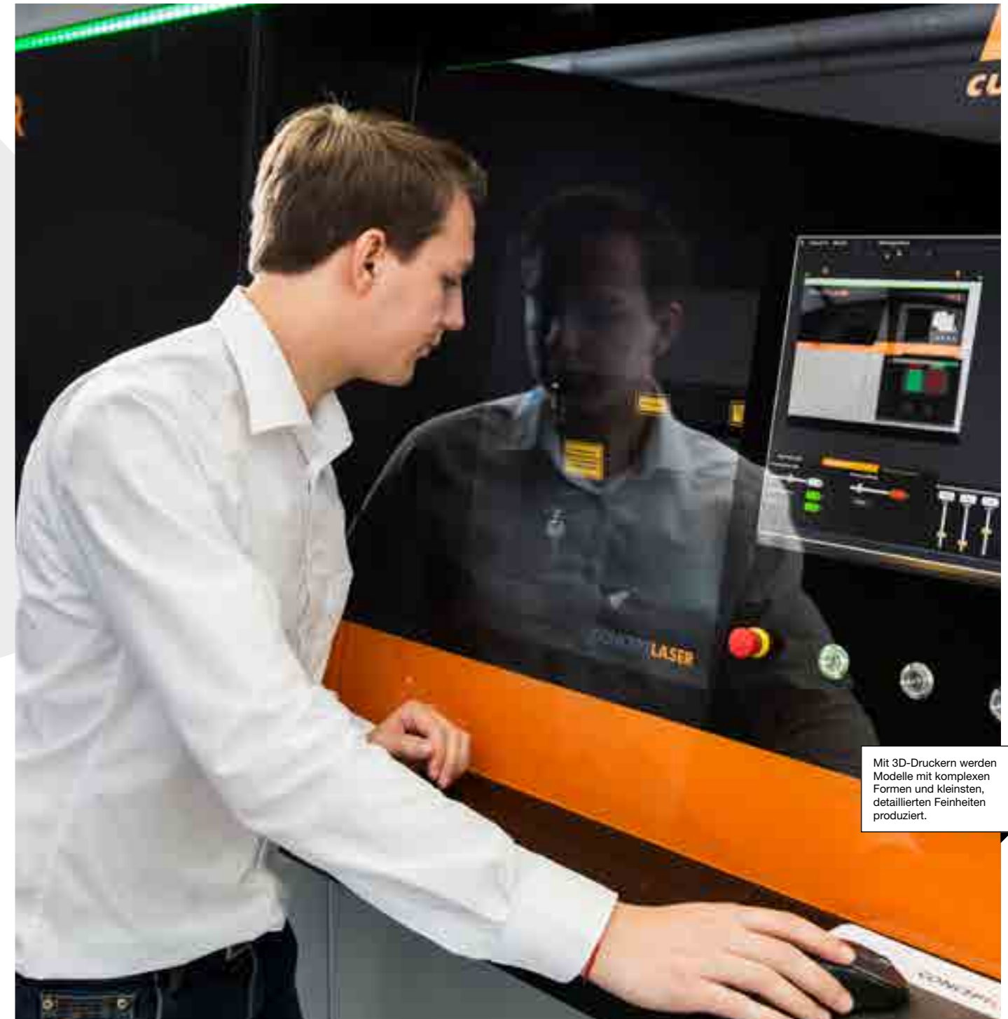
Mit 3D-Druckern werden Modelle mit komplexen Formen und kleinsten, detaillierten Feinheiten produziert.