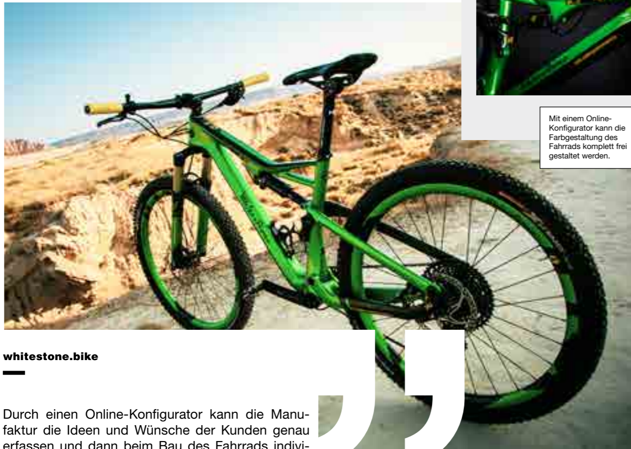
Mit einem Online-Konfigurator kann die Farbgestaltung des Fahrrads komplett frei gestaltet werden.