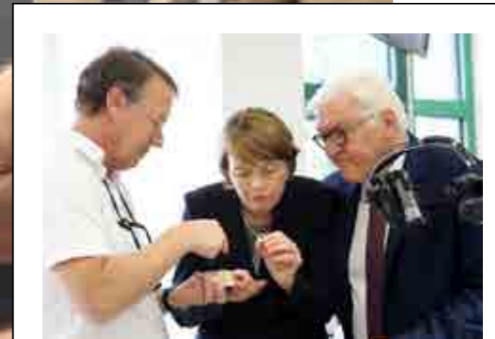
Hoher Staatsbesuch zum diesjährigen Ausbildertag der Handwerkskammer Berlin: Anlässlich der bundesweiten „Woche der beruflichen Bildung“ waren Bundespräsident Frank-Walter Steinmeier und seine Frau Elke Büdenbender zu Gast im Bildungs- und Technologiezentrum der Handwerkskammer Berlin.