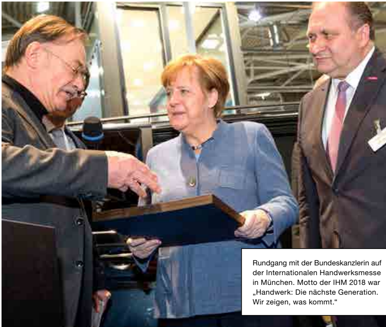
Rundgang mit der Bundeskanzlerin auf der Internationalen Handwerksmesse in München. Motto der IHM 2018 war „Handwerk: Die nächste Generation. Wir zeigen, was kommt.“