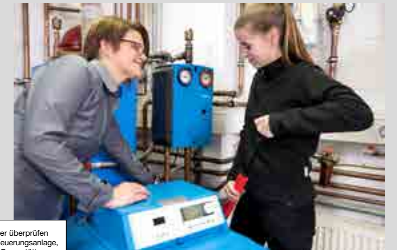
Schornsteinfeger überprüfen die komplette Feuerungsanlage, bestehend aus Feuerstätte (Heizung), Verbindungsstück und Schornstein.

Ja, auf jeden Fall. Wir haben heute aber nicht mehr nur den Schornstein und die Heizung im Blick, sondern die gesamte Gebäudehülle.